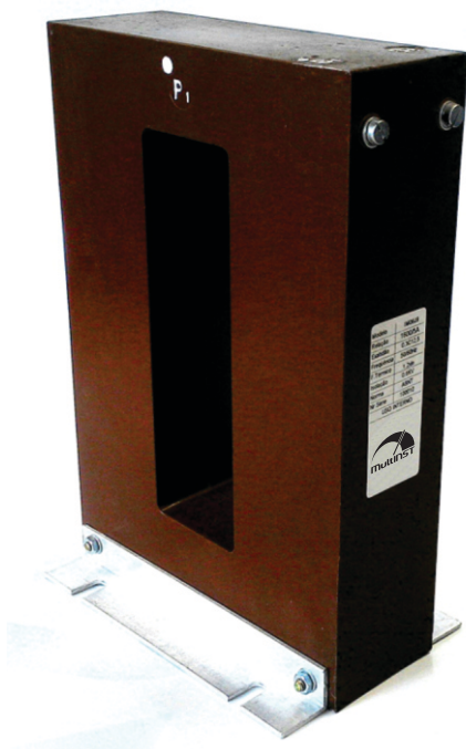
Transformador de corrente Medição ou Proteção 0,6kV